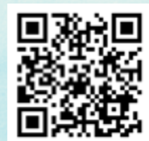
חוני המעגל - מוזיקה בלבד