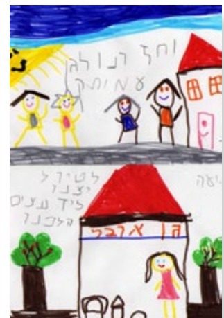
ילדי גן "ארבל" מאיירים את השיר "הטיול הקטן" מאת נעמי שמר ובעקבות זאת את טיול ילדי הגן לשרה ליד הגן.