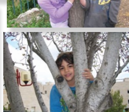
5) תמונות עליונות) ילדי גן "ארבל" במבשרת מתבוננים במפות אמיתיות (5 תמונות תחתונות) ילדי גן "ארבל" בפעילויות במסגרת המיזם "חבק עץ"