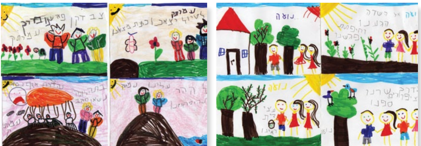
ילדי גן "ארבל" מאיירים את השיר "הטיול הקטן" מאת נעמי שמר ובעקבות זאת טיול ילדי הגן לשדה ליד הגן.

לסיום, העיסוק בטבע ובסביבה בגן לימד אותי כמה פשוט, זמין וקל להעניק לילדים תכנים וערכים. הטבע