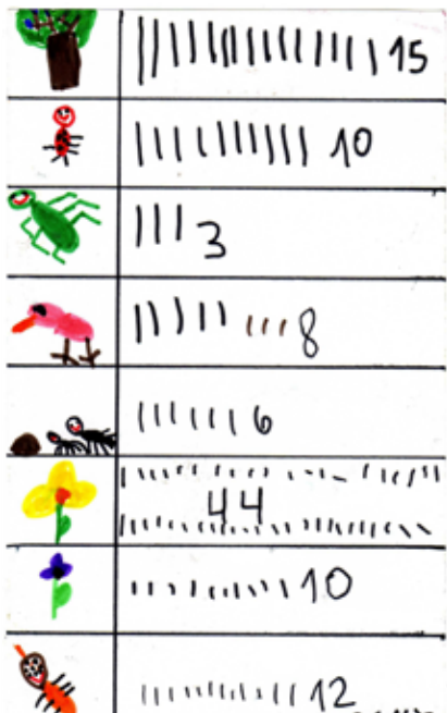
טבלה מצוירת שבה תיעדה עמית את הצמחים ואת בעלי החיים שראתה