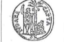
מטבע 'יוודיא קאפטה' (יהודי דה השבורה)

מרושם המיחור של הטנט הרומי, שחונכו ברובם לרנל הנצחון הצבאי של הלגיונות הרומיים בירושלים, נקבלה חילתם כי כל כלי המקדש שחלקו שלל על הקרבות על הר הכית, יהיו נעשה רכושם הכלעי של הקיסרות הרומית. במקביל הוציא גם טיטוס צו להגביה את המקדש לרומא. ארון הכית, השולחן והמזבחה וכל יתר כלי המקדש יושעו חרן ימים ספורים על ספינה מלחמה של