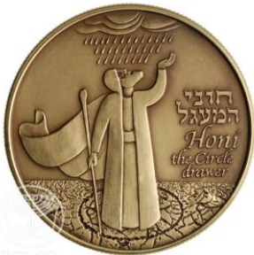
מדליית חוני המעגל בעיצוב האמן אהרון שבו

רצונו. ועליך הפתוב אומר: "ישמח אביך ואמך ותגל יולדתך" (משלי כג, כה)