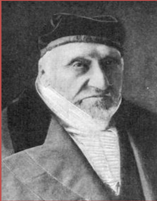
מֹשֶׁה מוֹנְטֵיפּוֹרִי בְּבִקּוֹר בִּירוּשָׁלַיִם.

הַאֵם יֵשׁ פְּתָרוֹן לְכָל הַקְּשָׁיִים שֶׁל תּוֹשְׁבֵי יְרוּשָׁלַיִם?